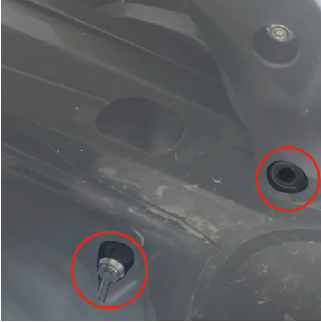
İşaretlenen vidaları T30 torx anahtarları ile çıkartınız. (Remove the marked screws using a T30 Torx wrench.)