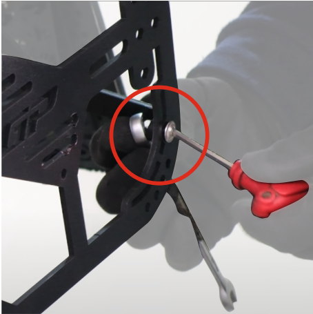
Çanta demiri ve bağlantı aparatını 4mm alyan ve 10mm anahtar ile sabitleyiniz. (Secure the bag frame and connection accessory using a 4mm allen and a 10mm wrench)