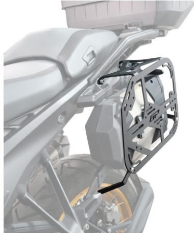
Her iki tarafıda aynı şekilde monte ediniz. (Mount both sides in the same way.)